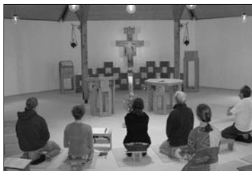
Die Kapelle - Lebensmittelpunkt und Erfahrungsort von Gemeinschaft

dass sich das Leben und Arbeiten am gemeinsamen Gebet und der Liturgie ausrichtet. Die Kapelle ist wirklich der Lebensmittelpunkt, und hier wird die Gemeinschaft auch am stärksten erlebbar.